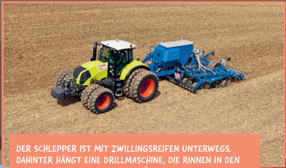
DER SCHLEPPER IST MIT ZWILLINGSREIFEN UNTERWEGS. DAHINTER HÄNGT EINE DRILLMASCHINE, DIE RINNEN IN DEN ACKER ZIEHT UND DARIN SAMENKÖRNER ABLEGT.

Beim Bau von Straßen und Häusern wird der Boden mit Beton, Asphalt oder Pflastersteinen bedeckt. Größer als sieben Fußballfelder ist die Fläche, die so in Deutschland jeden Tag abgedeckt wird! Für die Umwelt ist das ein Problem. Denn das verhindert, dass dort Regenwasser gut versickern kann.